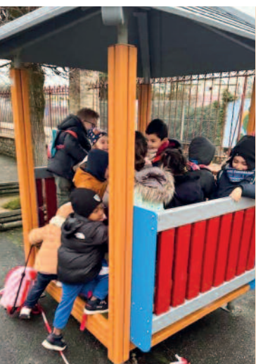
Aire de jeux prise d'assaut par les bouts de chou de l'école maternelle.