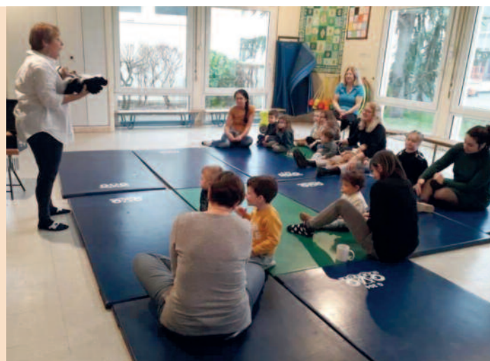
Atelier contes en janvier autour de la traditionnelle Galette des Rois pour les enfants du RPE (relais petite enfance).