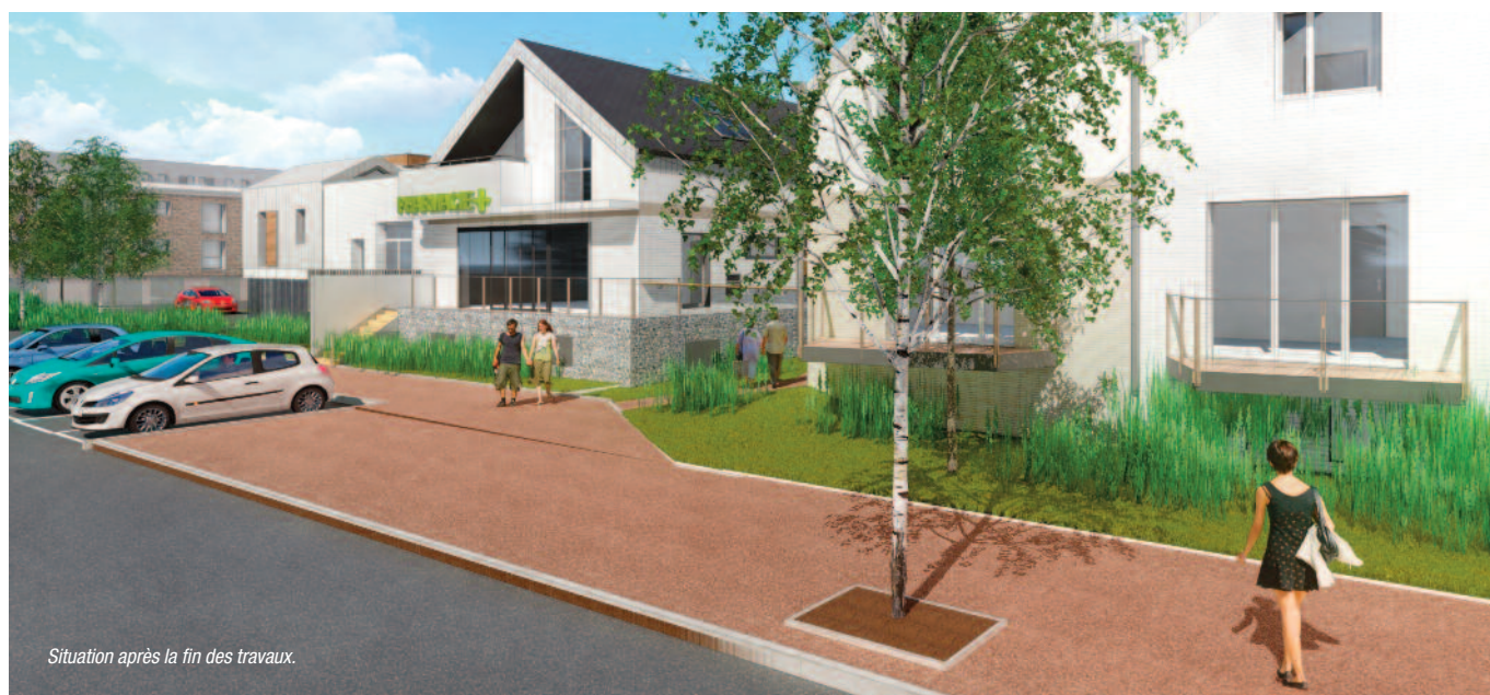
Situation après la fin des travaux.