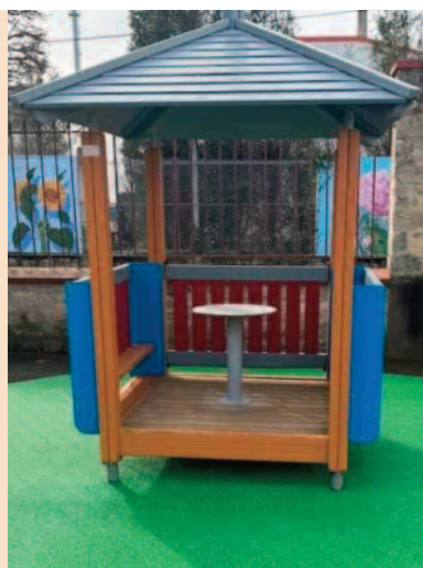
Tapis de sol pour la nouvelle cabane école maternelle.